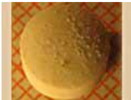
Durchmesse: 7.07mm; Dicke: 4.96mm; Gewicht: 180mg

ChEck iT Wien! hat zum ersten Mal seit 2001 wieder eine PMA (Paramethoxyamphetamin) haltige Tablette getestet, die als „Ecstasy“ verkauft wurde. Ca. eine Stunde nach der Einnahme von PMA steigen Blutdruck und Körpertemperatur plötzlich und stark an. Da UserInnen selten wissen, dass sie PMA und kein Ecstasy nehmen, kommt es vor dass "nachgeworfen" und somit überdosiert wird, noch bevor die Symptome auftreten. Dieser Irrtum kann lebensgefährlich sein. Bis zum jetzigen Zeitpunkt wurden in Zürich noch nie PMA Pillen analysiert. Deshalb gehen wir nicht davon aus, dass PMA haltige Pillen im Rahmen der Street Parade auf dem Markt sind!